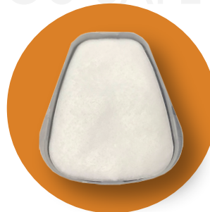
Pre-Filtro montado en retenedor